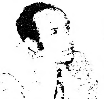
المحور عدة : حلول لزمة الحوم